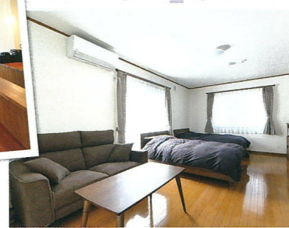
くつろげる空間です。