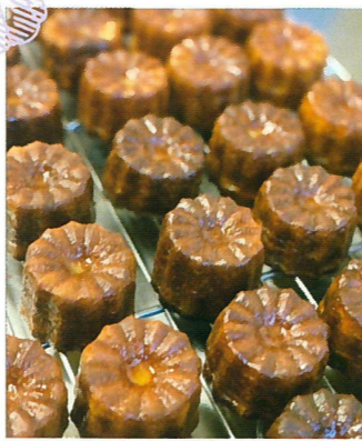
ごちがま手製のカヌレ