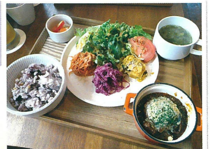
人気のランチメニューです