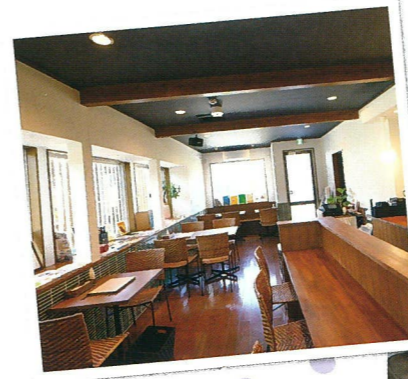
カフェ内装と宿泊部屋